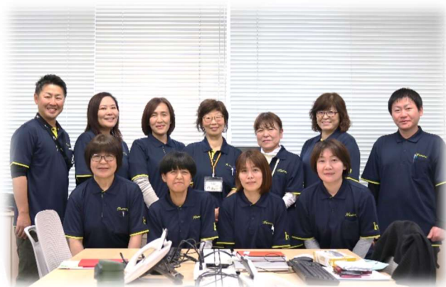
ハーモニー広沢ケアマネージャー